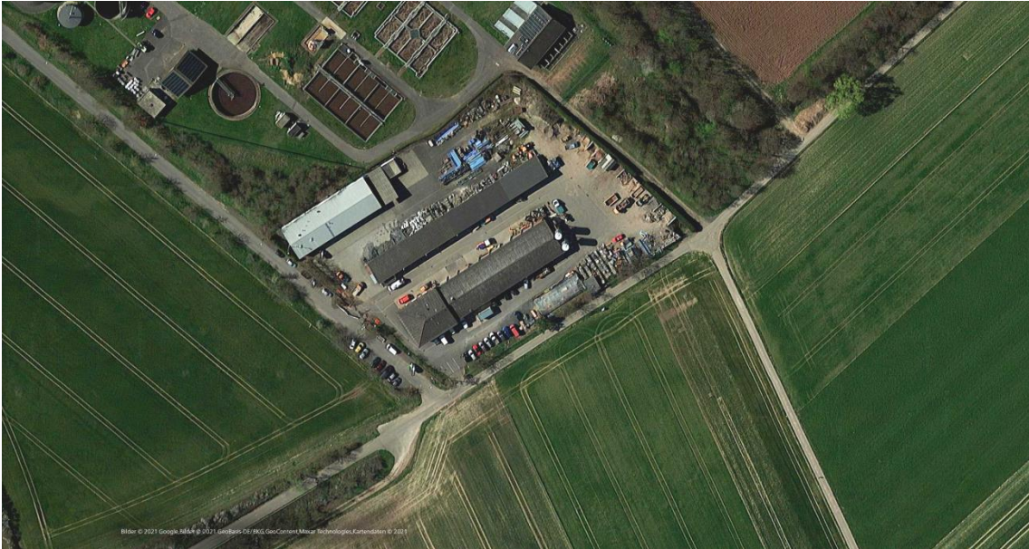
Der Betriebshof im Bestand aus der Vogelperspektive