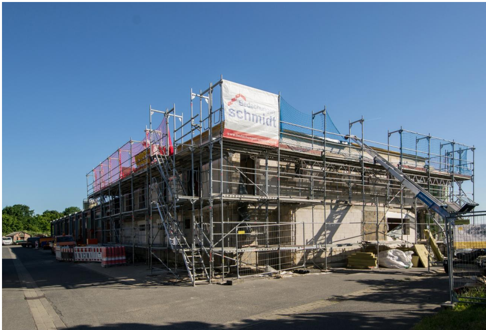
Beys Architekten Betriebshof Rheinbach Nachhaltige Sanierung