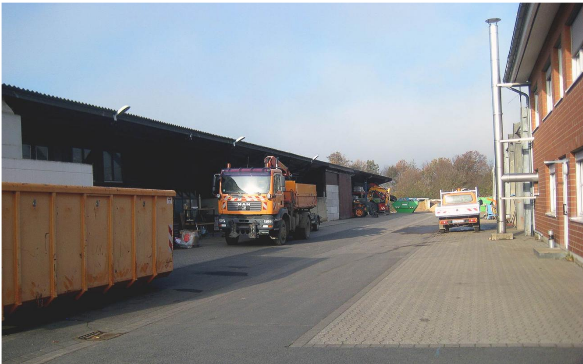
Blick auf den Hof mit Sozial- und Bürogebäude auf der rechten Seite

client: Stadt Rheinbach location: Rheinbach building type: Werkgebäude services: Sanierung, Umbau, Erweiterung und Neubau area: Büro + Gewerbe Umbau + Sanierung scope of services: Objektplanung Lph 1-9 HOAI, Generalplanung Lph 1-9 HOAI inkl. Freianlagenplanung, Tragwerksplanung, TGA, Brandschutz, SiGeko und Erdbebensicherung completion: 2026 period: 05/2021 - 05/2026