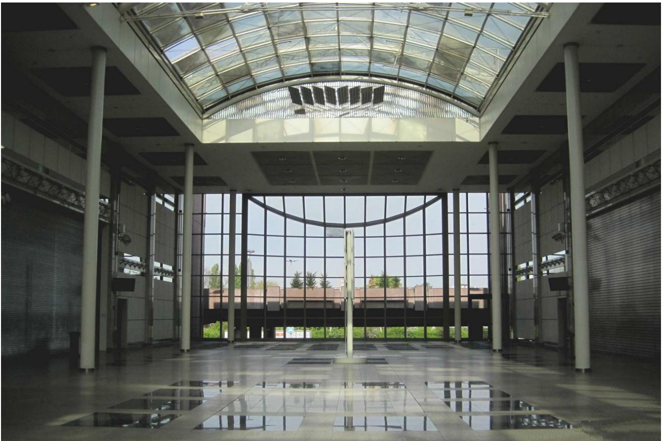
Zustand vor Beginn der Sanierungsarbeiten

Neben der Erneuerung des Daches und der Erstellung eines neuen Raumkonzeptes zur flexiblen Gestaltung der Gastronomie, haben wir ein modernes Farb- und Beleuchtungskonzept erstellt und die Fassade an der Stirnseite des Gebäudes vollständig erneuert.