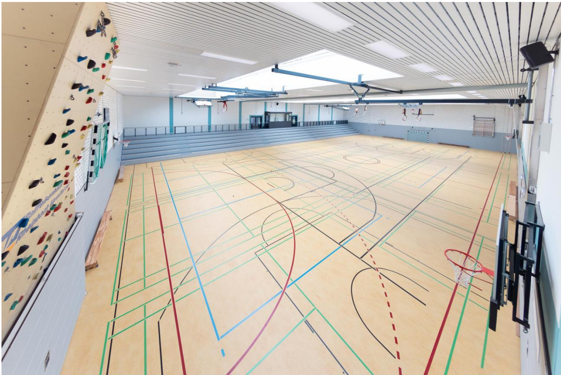
Dreifeldsporthalle mit Kletterwand