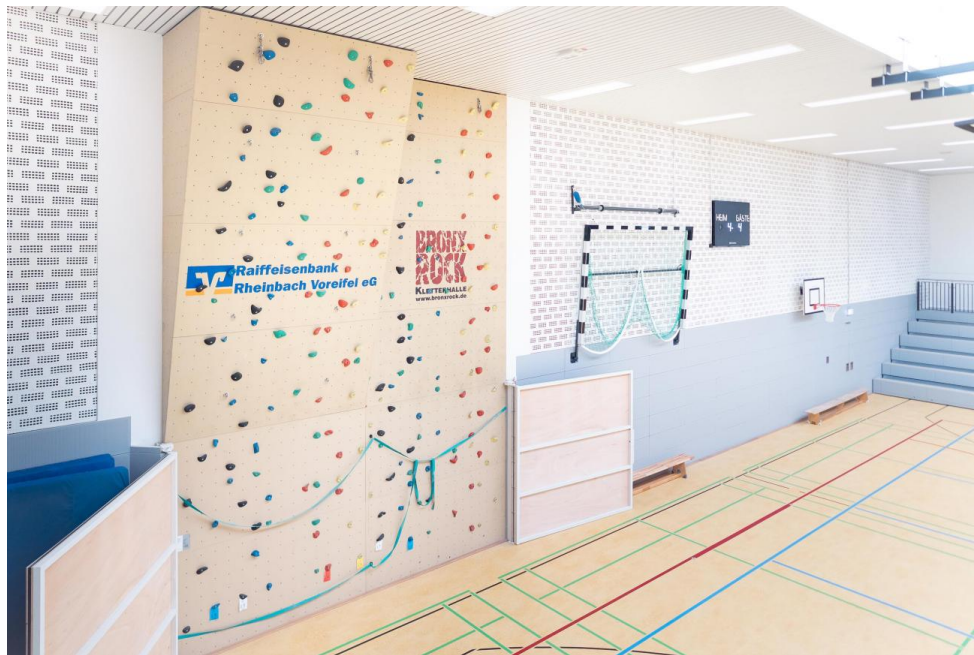
Kletterwand und hochfahrbare Handballtore