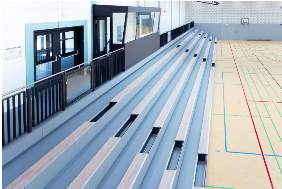
Einfahrbare Tribüne über die gesamte Längsseite