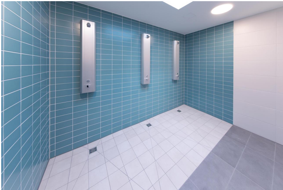
Sammelduschen der Gruppenumkleiden