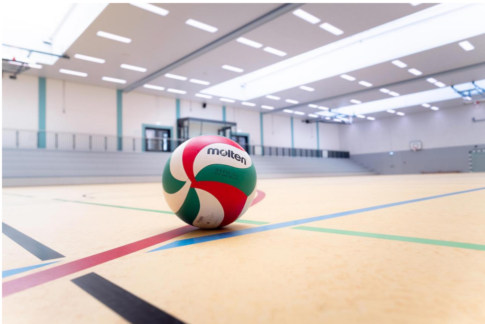
Diverse Sportarten durch umfangreiche Sportboden-Linierung in Dreifeldhalle und separierten Einzelhallen möglich