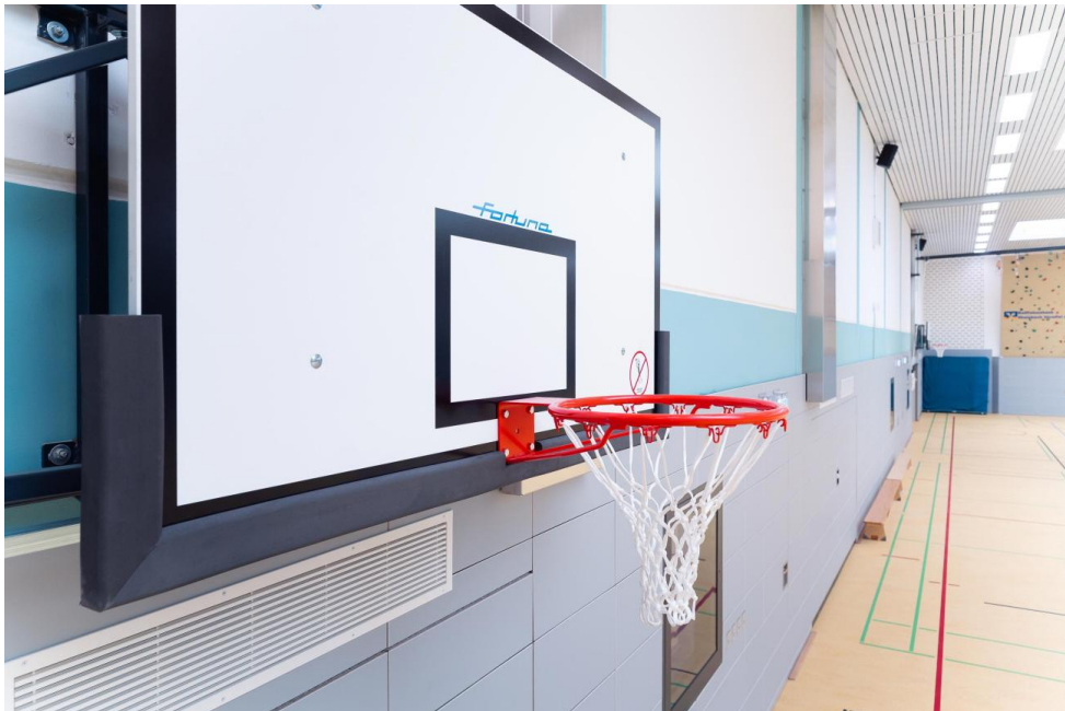
Basketballkörbe können sowohl an der Decke, als auch an der Wand eingeklappt werden