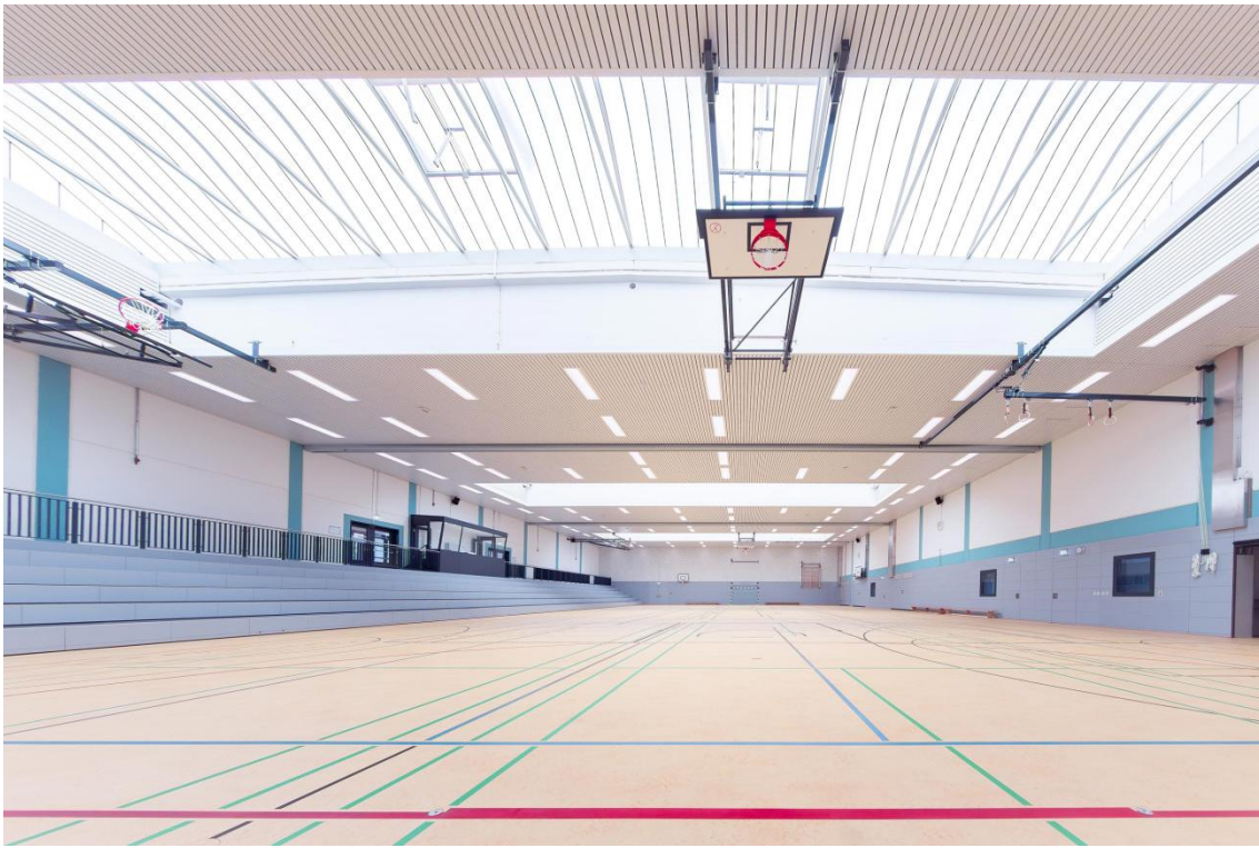
Tageslicht und neue LED-Beleuchtung sorgen für ein lichtdurchflutetes Spielfeld