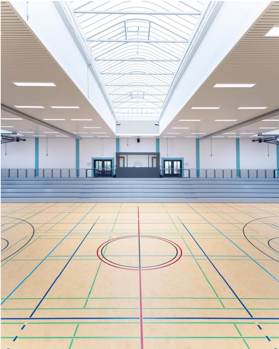
Sportboden, Prallschutz und Tribüne wurden erneuert