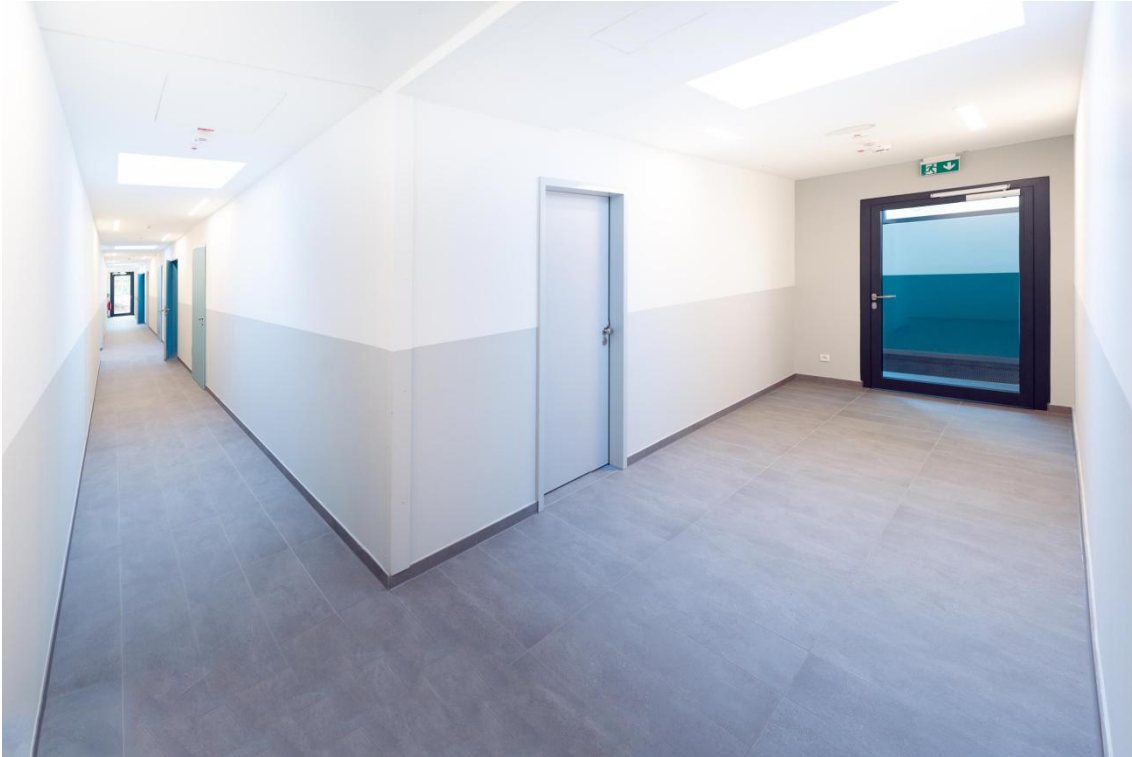
Verbindungsgang in der Sporthalle