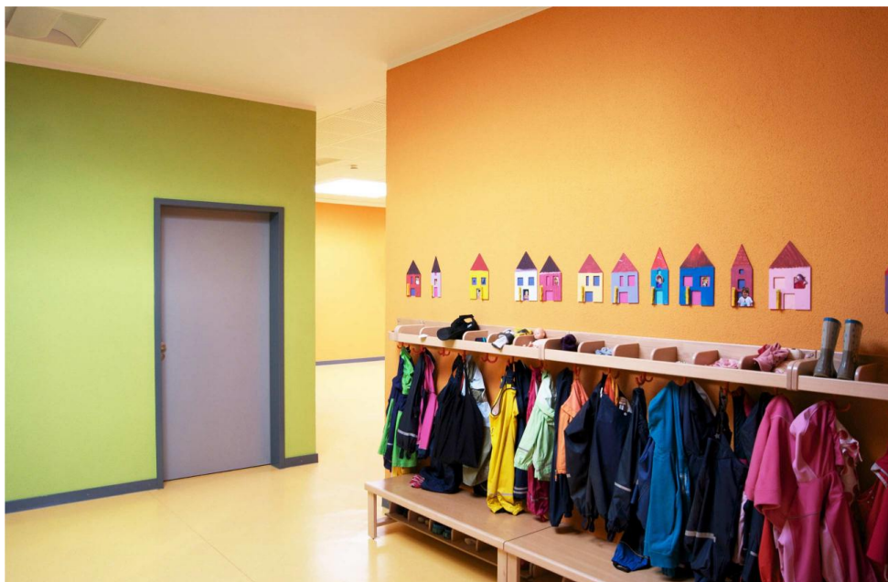
Garderobe vor dem Gruppenraum.