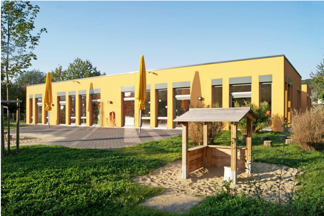
Der Außenspielbereich mit Terrasse und Spielinsel.