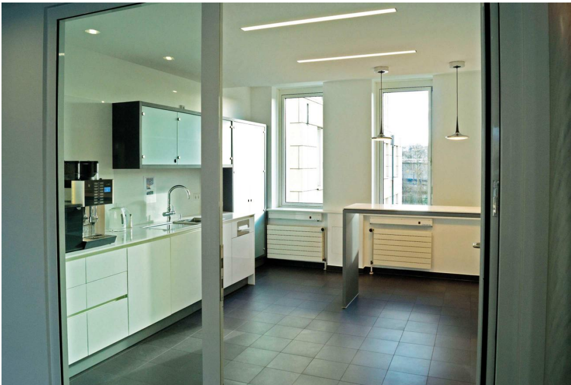
Die Teeküche öffnet sich zum Foyer.

Schränke und Stehtische werden in hochglänzendem Kunststoff gefertigt, die Arbeitsplatten sind aus einem ebenfalls weißglänzenden Kunststein. Dem zurückhaltenden Gestaltungsansatz entsprechend wird auf sichtbare Griffe verzichtet. Die Oberschränke sind mit Glasschiebetüren ausgestattet.