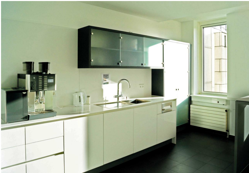
Innenansicht Teeküche mit hochglänzenden Kunststofffronten.