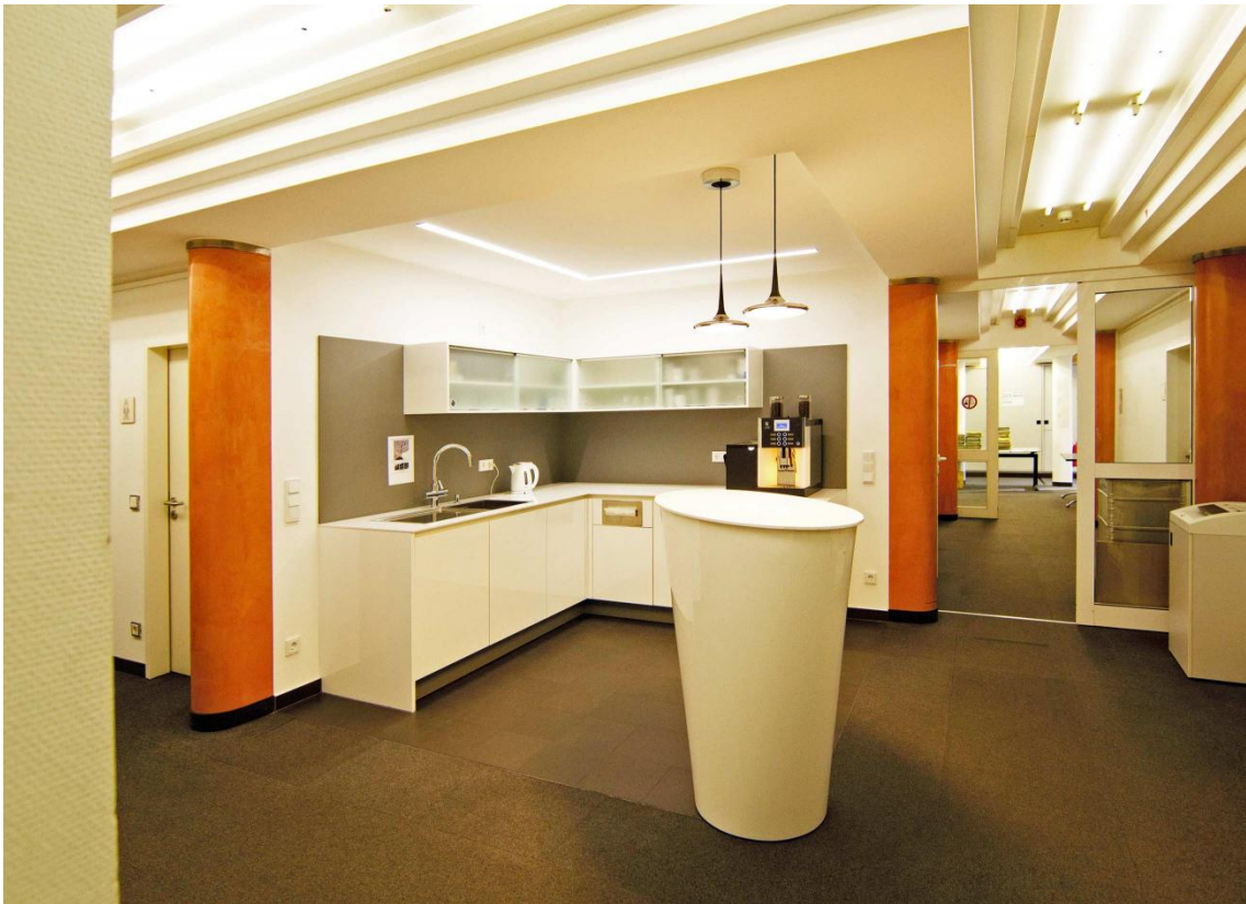
Anordnung im Kreuzungspunkt zweier Flure.