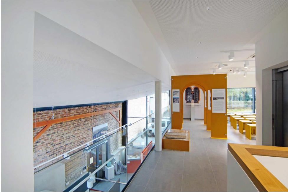
'Römerkanal Informationszentrum', Galerie