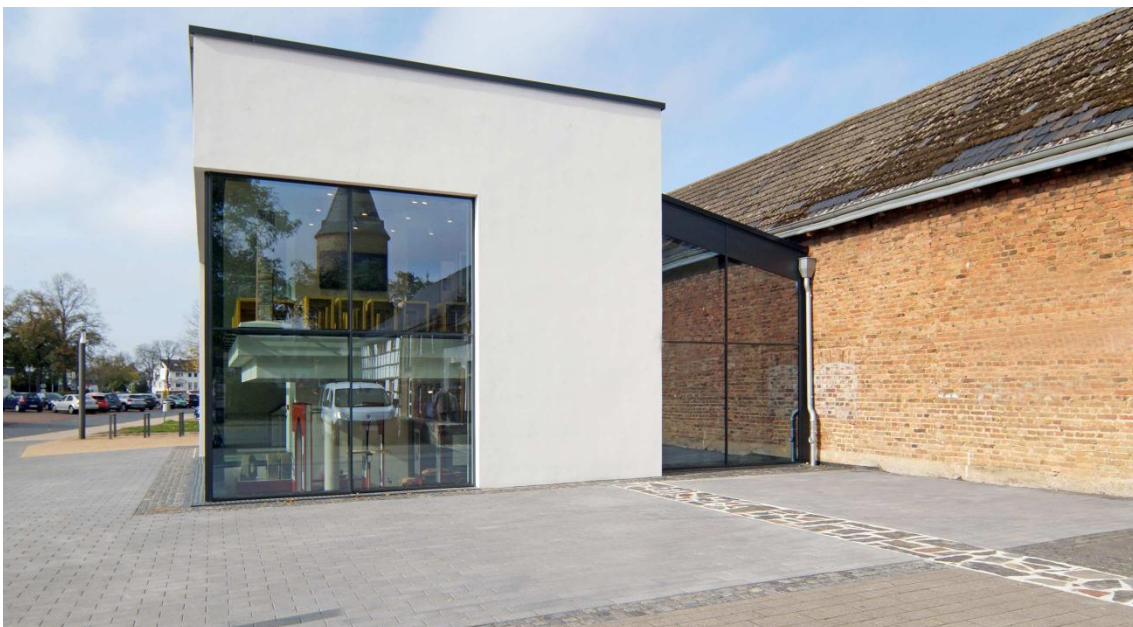
'Römerkanal Informationszentrum', Aussenansicht