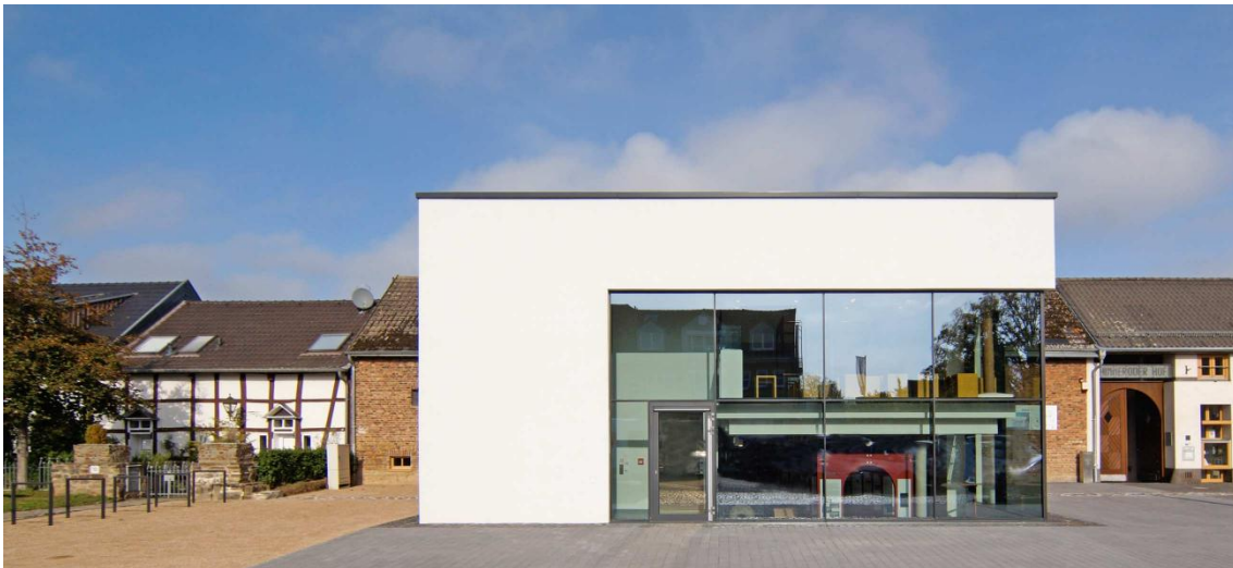
Der zweigeschossige Neubau wird dem historischen Gebäudekomplex vorgelagert und schließt an die Südfassade des Hofkomplexes an.