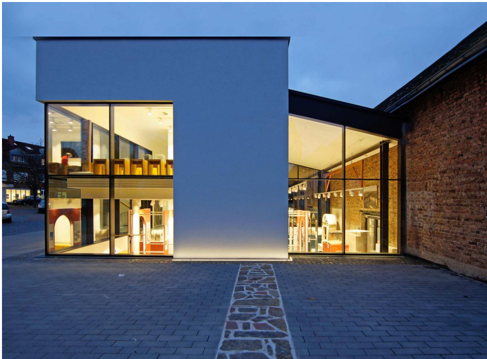
'Römerkanal Informationszentrum', Nachtaufnahme