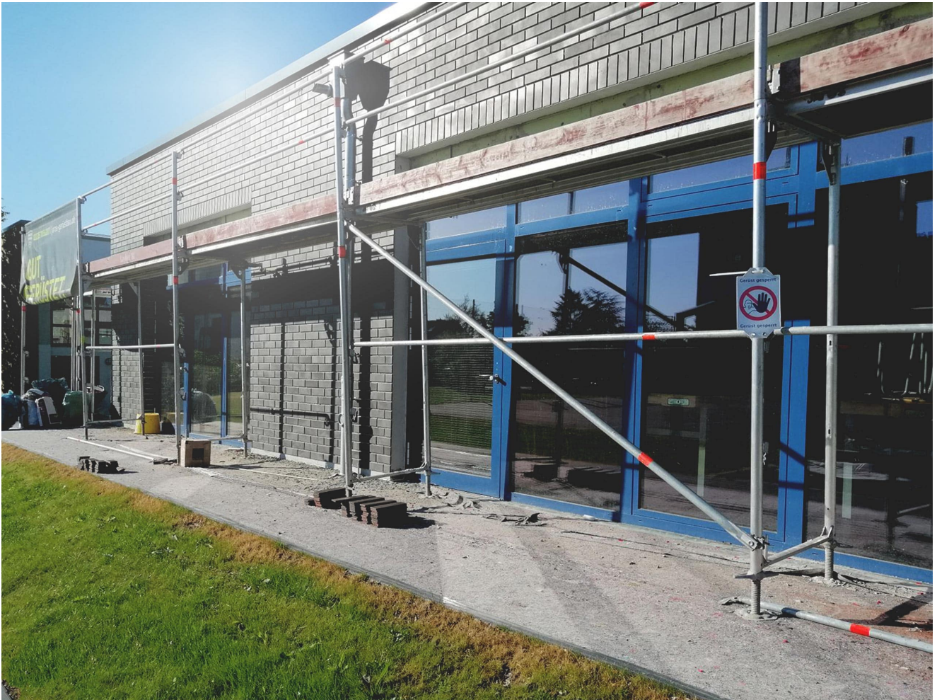
Umbau, Sanierung, Erweiterung Schulstandort 'Stettiner Straße', Euskirchen