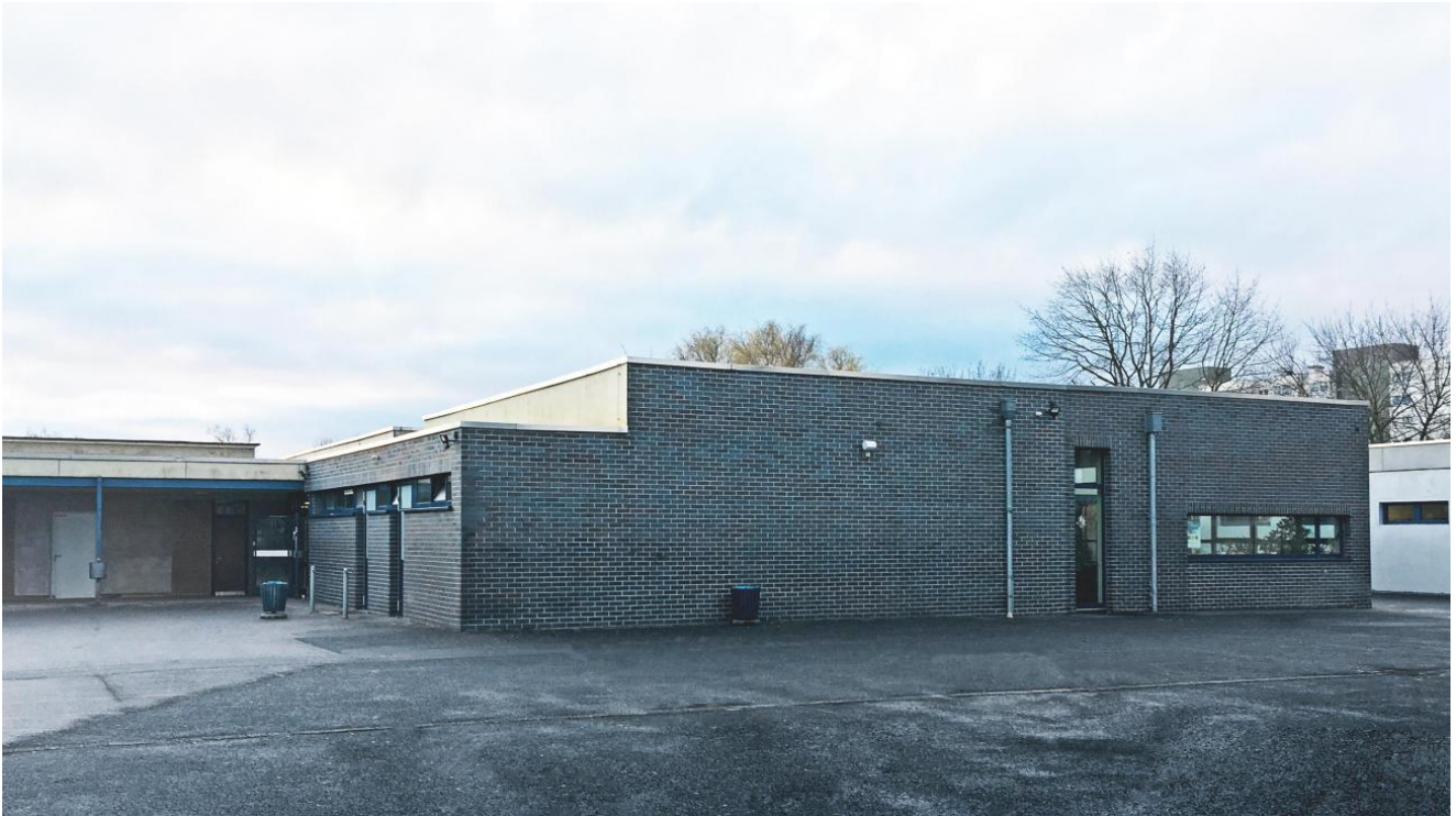
Ansicht vom Schulhof auf einen Gebäuderiegel mit fertiggestellter Fassade

Sämtliche Baumaßnahmen erfolgen im laufenden Schulbetrieb. Dabei müssen bspw. Fluchtwege der sich ständig ändernden Baustellensituation angepasst und unvermeidbare Lärmemissionen, für einen ungestörten Unterricht, klein gehalten werden.