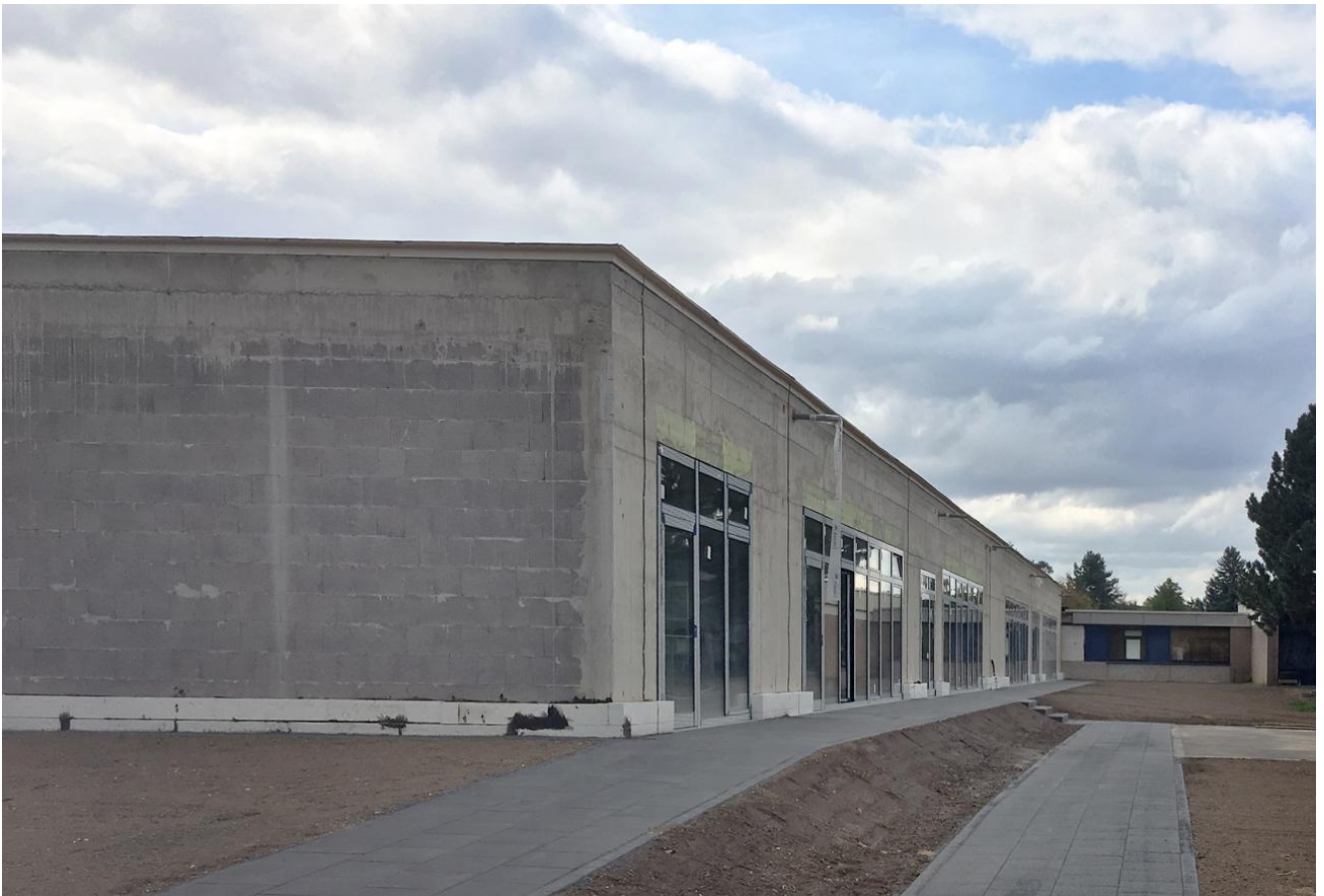
Rohbau Erweiterung Kaplan-Kellermann-Realschule