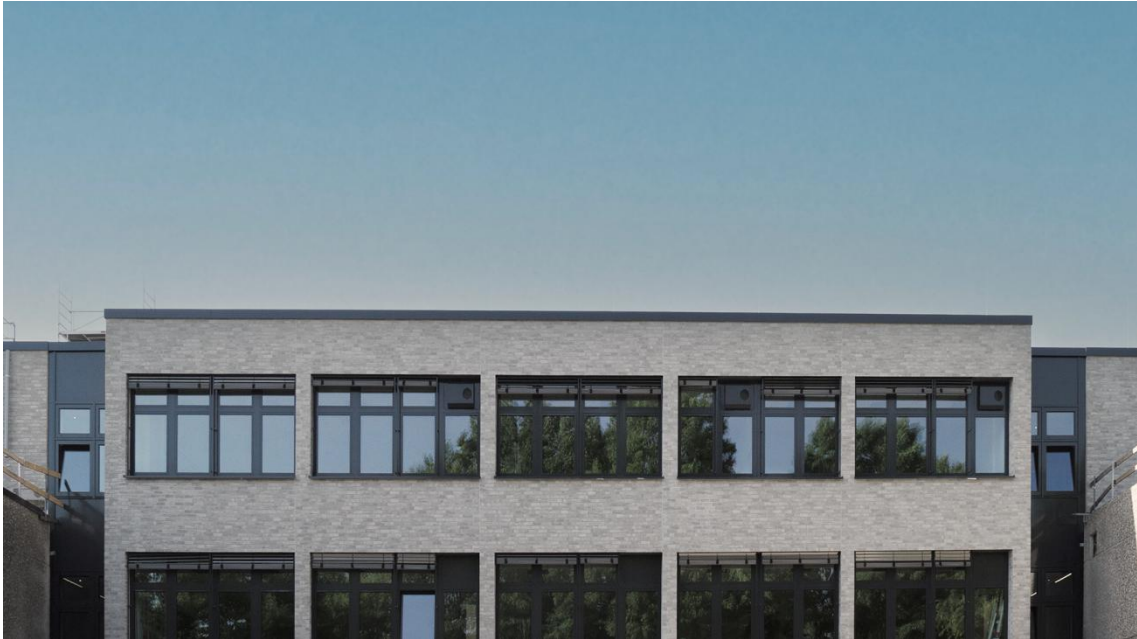
Beys Architekten Energetische Sanierung WHG Leverkusen