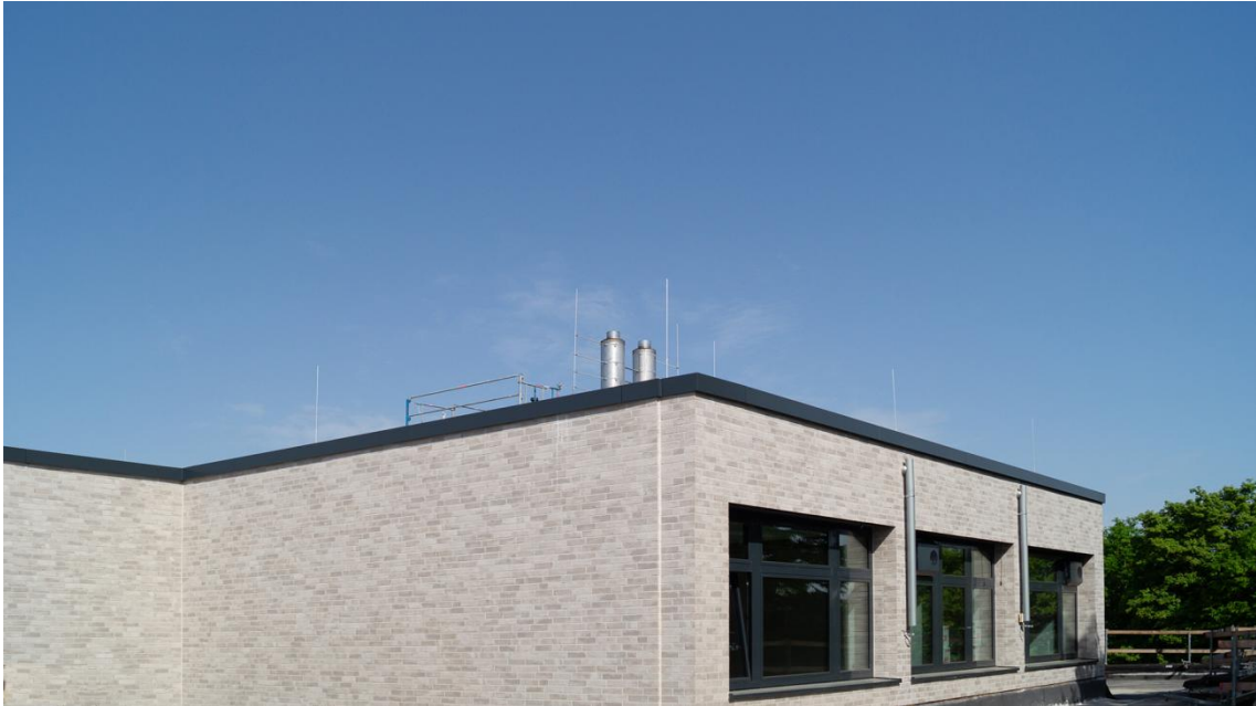
Beys Architekten WHG Sanierung Dach Fassade