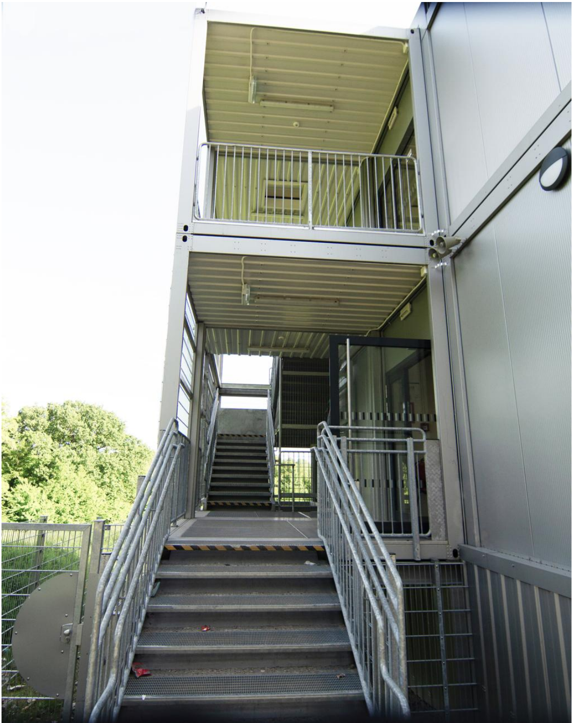
Beyss Architekten WHG Leverkusen Interim Container